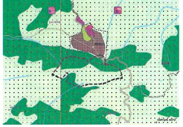
ÇDP Değişikliği Sonrası Durum