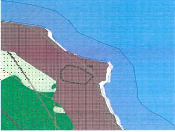
ÇDP Değişikliği Sonrası Durum

Ordu-Trabzon-Rize-Giresun-Gümüşhane-Artvin Planlama Bölgesi 1/100.000 ölçekli Çevre Düzeni Planı'nın amaç, ilke ve stratejileri ile Mekânsal Planlar Yapım Yönetmeliği'nin çevre düzeni planlarında değişiklikleri düzenleyen 20. Maddesinin 2. Fıkrasının “(a) Kamu Yatırımları”, ve “(d) Değişen verilere bağlı olarak planın güncellenmesi” hükümleri çerçevesinde yapılan değerlendirmeler sonucunda; Ordu-Fatsa-Çerkezler Turizm Merkezi sınırının 29.01.2024 tarih ve 3456 sayılı Cumhurbaşkanlığı Kararı, Ordu Akkuş Argın Yaylası Turizm Merkezi sınırının ise 01.07.2024 tarih ve 8701 sayılı Cumhurbaşkanlığı Kararı ile iptal edildiği hususu göz önünde bulundurulduğunda, söz konusu Turizm Merkezi Sınırlarının kaldırılması suretiyle Ordu-Trabzon-Rize-Giresun-Gümüşhane-Artvin Planlama Bölgesi 1/100.000 ölçekli Çevre Düzeni Planı Değişikliği hazırlanmıştır.