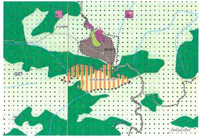
Akkuş Argın Yaylası Turizm Merkezi